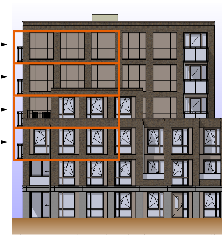
Aanzicht Koppelstokstraat 1:200