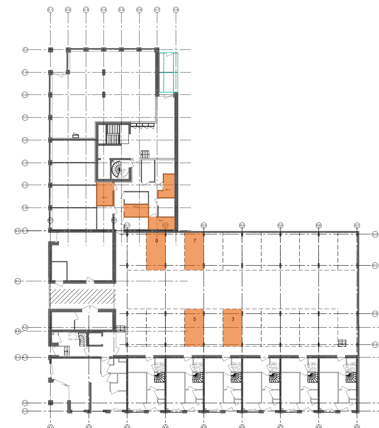
Overzicht berging - parkeren 1:300