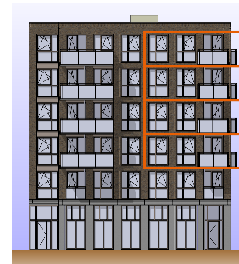
Aanzicht Lelykade 1:200