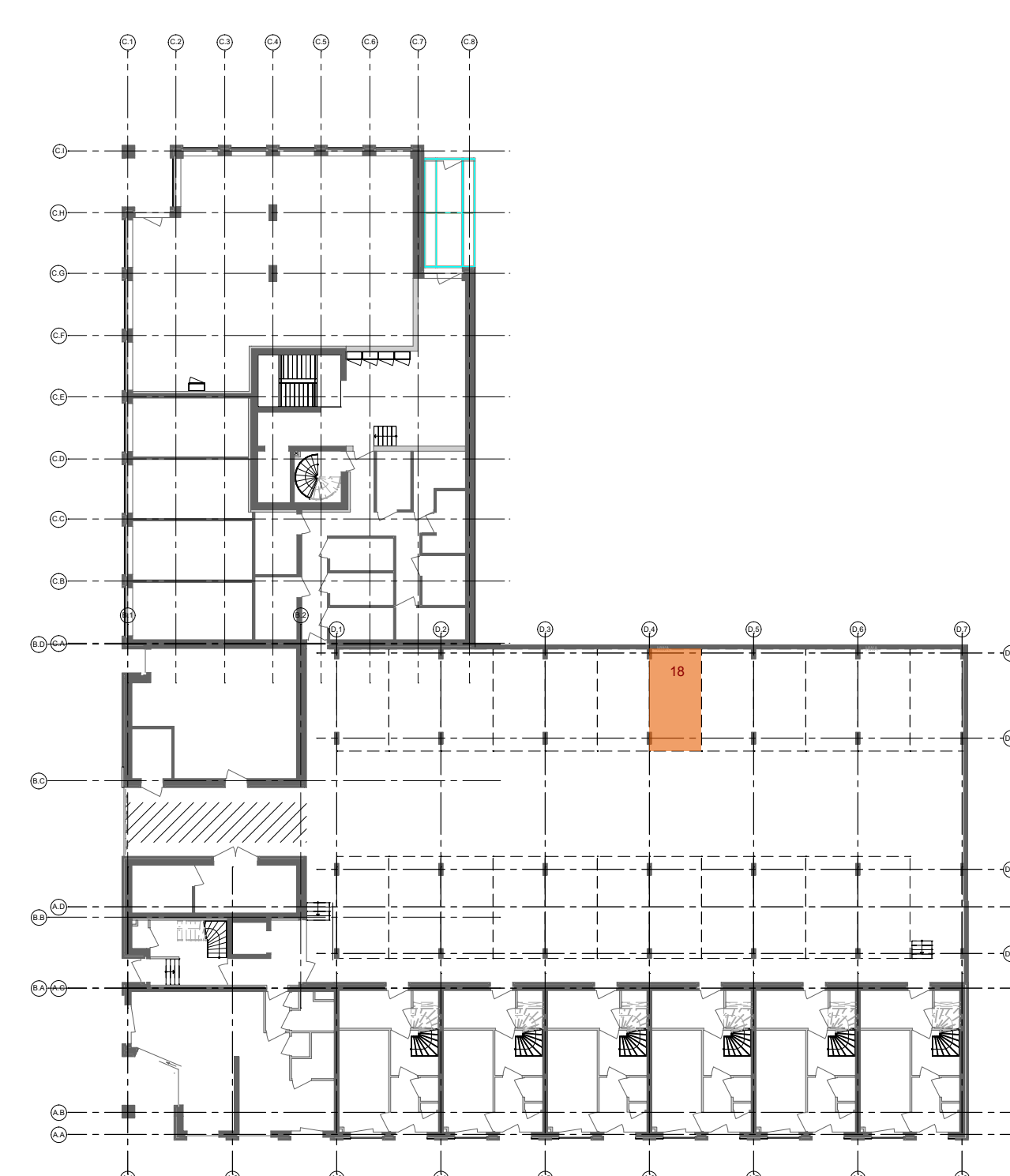
Overzicht parkeren 1:300