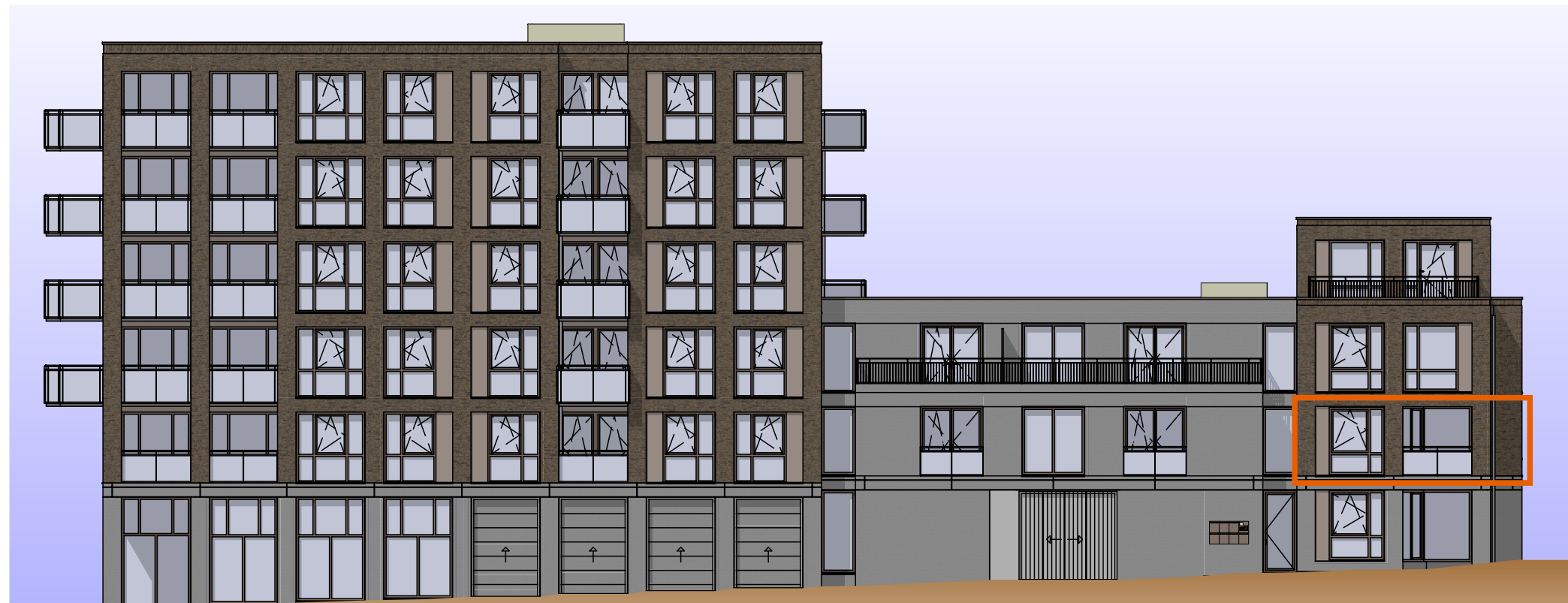
Aanzicht Menninckstraat 1:200