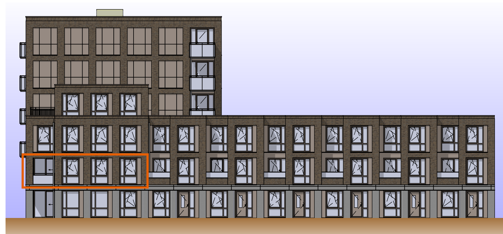
Aanzicht Koppelstokstraat 1:200