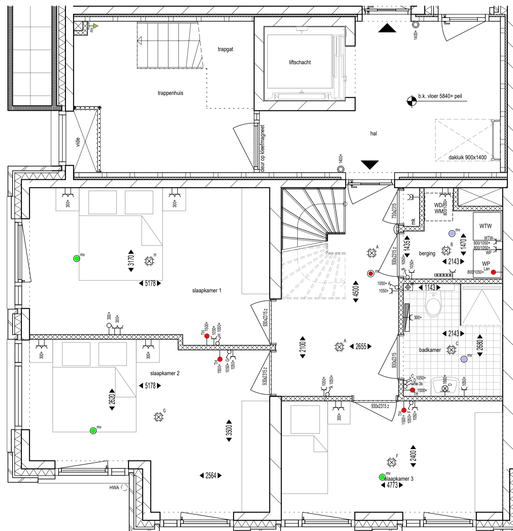
Plattegrond begane grond 1:50